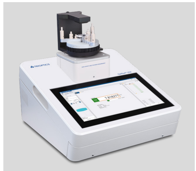
Das berührungslose Mittendickenmesssystem OptiSurf® LTM von TRIOPTICS

tigungsprozesse im eigenen Unternehmen auf Effizienz und Effektivität geprüft. Dabei stellte sich heraus, dass insbesondere die bisher genutzten Technologien und Systeme zur