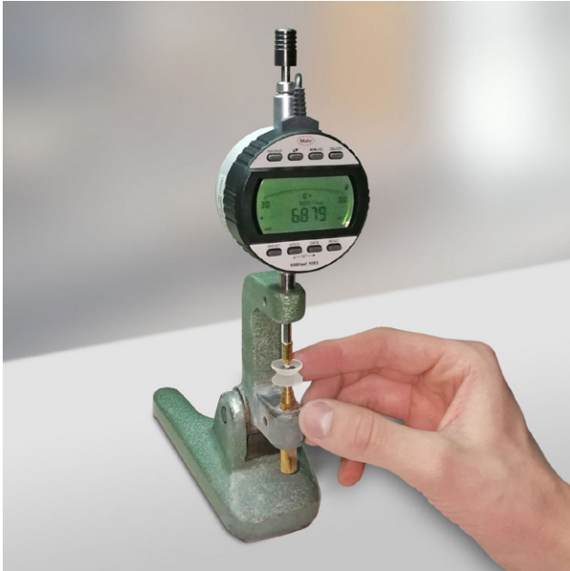
Mechanische Messuhr im Einsatz bei Pfeiffer Präzisionsoptik